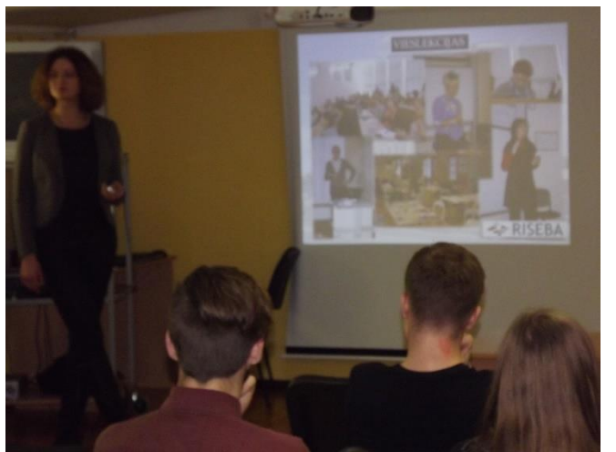
Tikmēr konferenču zālē 58 interesenti varēja noskaidrot par studiju iespējām RISEBA