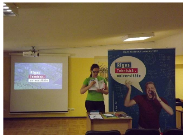
Karjeras dienas noslēgumā ikviens interesents varēja uzzināt par studiju iespējām divās studentu skaita ziņā lielākajās augstākajās mācību iestādēs: Latvijas Universitātē un Rīgas Tehniskajā universitātē (tās bija pieteikušies apmeklēt 156 (LU) un 42 (RTU) skolēni)