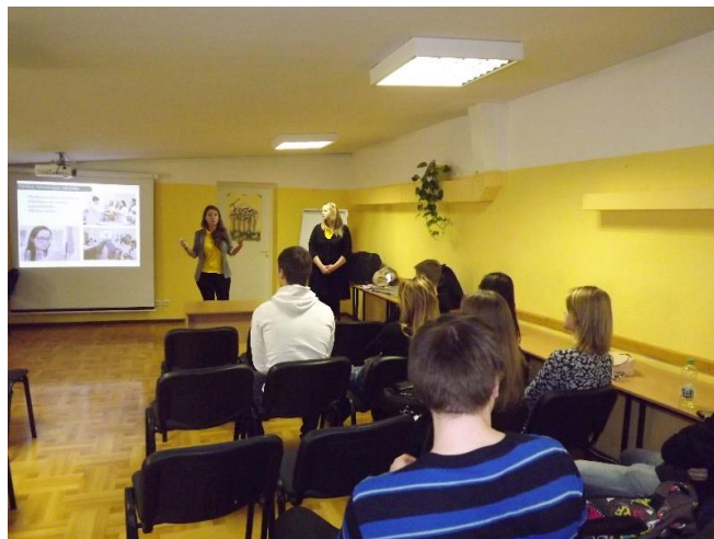
Tikmēr konferenču zālē 42 vecāko klašu skolēni varēja uzzināt par studiju iespējām Latvijas Lauksaimniecības universitātē