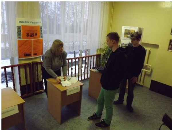
Par vispārējās vidējās izglītības ieguvu novada skolās varēja noskaidrot skolu plakātos, stendos un bukletos (attēlā pa kreisi – Engures vidusskola, pa labi – Tukuma Raiņa ģimnāzija, lejā – plakāts par Jaunpils vidusskolu un informācija par Tukuma 2.vidusskolu)