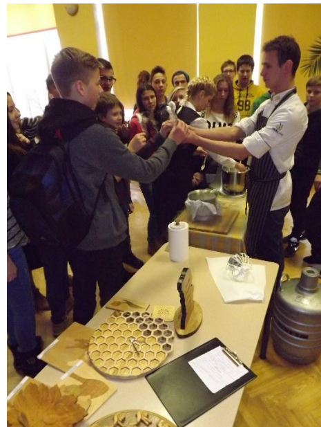
No Kuldīgas tehnikuma speciālistu uz vietas zālē gatavotā saldējuma spēja atturēties reti kurš no 131 klausītāju pulka