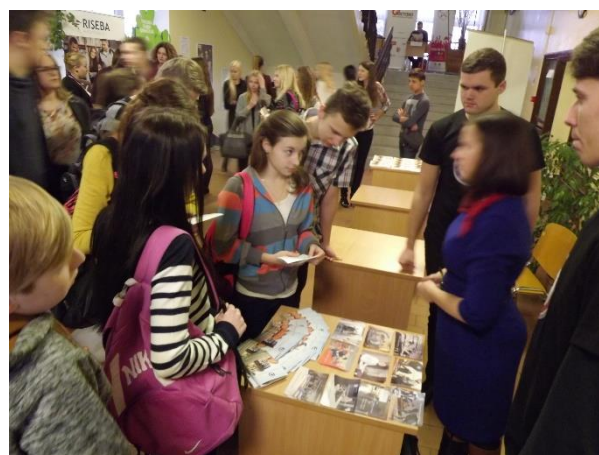
Informācija par Olaines Mehānikas un tehnoloģiju koledžu un par Jelgavas Tehnikumu