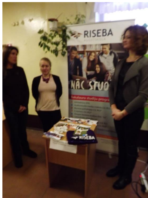
Izstādē izvietota informācija par Kandavas Lauksaimniecības tehnikumu (pa kreisi) un par RISEBA (pa labi), skolu pārstāvjiem uzdotot sev interesējošos jautājumus individuāli