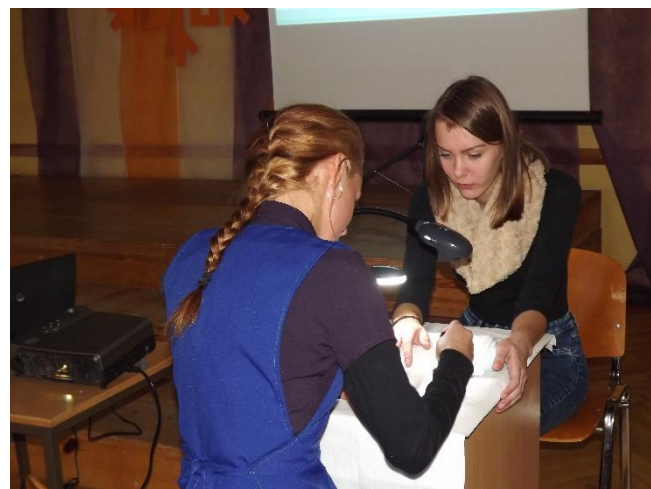
Kuldīgas Tehnoloģiju un tūrisma tehnikuma audzēkņi un pedagogi savā prezentācija ne tikai stāstīja, bet praktiski demonstrēja to, ko var apgūt viņu skolā