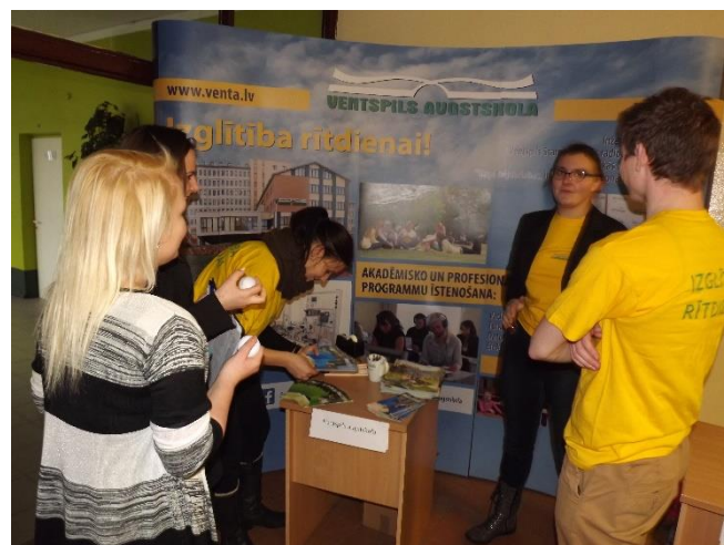
Informācija par RSU un RISEBA (pa kreisi) un par Ventspils Augstskolu (pa labi)