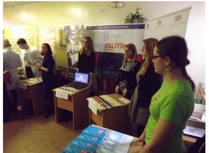
Izstādē informācija bija par studiju iespējām Latvijas Universitātē (augšā pa kreisi), Rīgas Tehniskajā Universitātē, kā arī RTU Inženierzinātņu vidusskolā un RTU Rīgas Biznesa skolā (pa labi augšā un lejā) un Latvijas Lauksaimniecības universitātē (lejā pa kreisi)