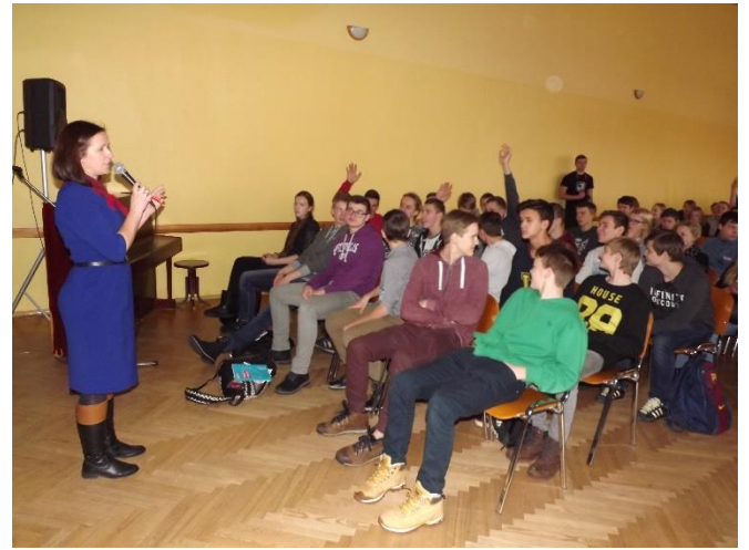
PIKC Jelgavas Tehnikuma pārstāvji skolēniem ne tikai pastāstīja, ko var apgūt šajā skolā, bet arī par to, ar ko atšķiras profesionālā izglītība (uz nodarbību bija pieteicies 161 interesents)