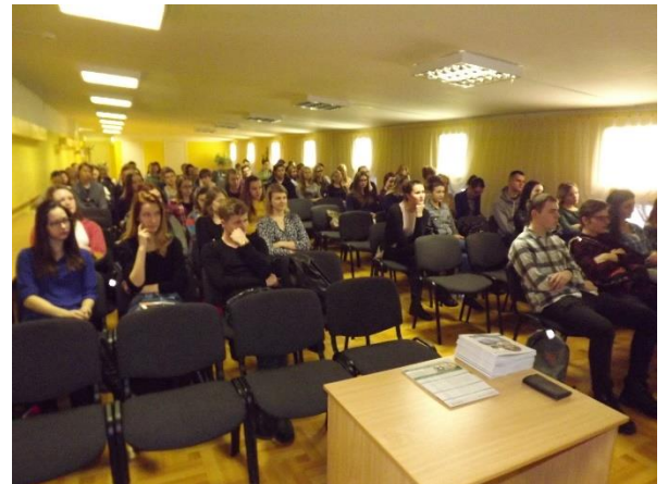
Vienlaikus konferenču zālē skolēni varēja uzzināt par studiju iespējām Vidzemes augstskolā (41 interesents, lai gan pieteikušies uz šo prezentāciju bija tikai 10 skolēni)