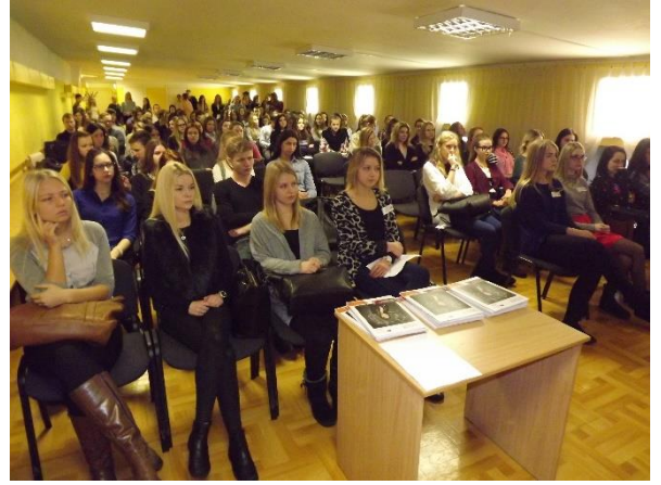
Ļoti liela interese bija par studijām Rīgas Stradiņa universitātē (104 interesenti)