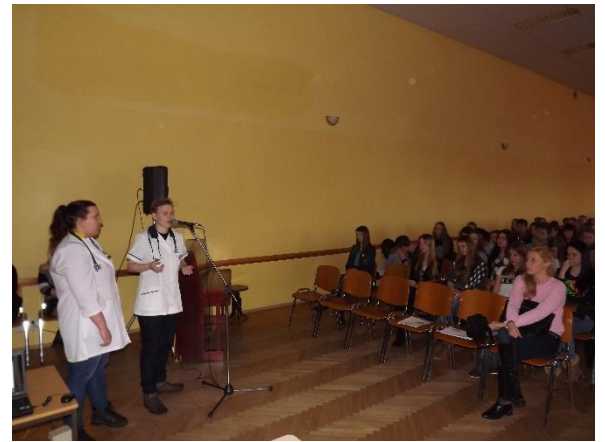
Skolēnus ieinteresēja LU Rīgas Medicīnas koledžas audzēkņu gan informatīvais, gan praktiskais – pieredzes stāstījums (pieteikušies 160 interesenti)