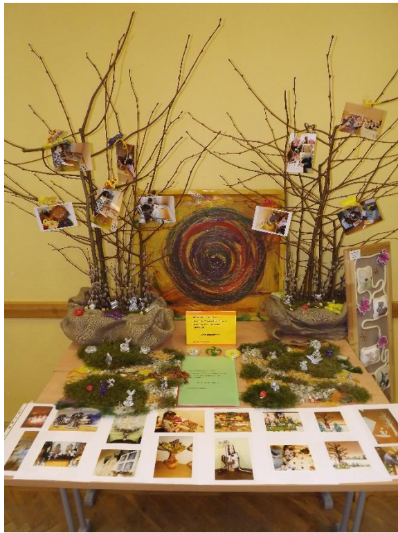
Vizuāli krāšņas kompozīcijas vērojamas Tukuma internātpamatskolas stendā