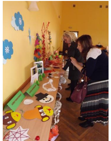
Ļoti daudzpusīga ir Pūres pamatskolas pedagogu pieredze