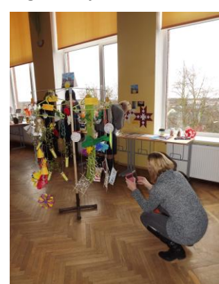
Un tā esam apgājuši apkārt visai zālei un varam sākt no jauna, lai kaut ko nofotografētu vai pierakstītu... Lai gan zāles vidū vēl Smārdes pamatskolas pieredze jāapskata ...