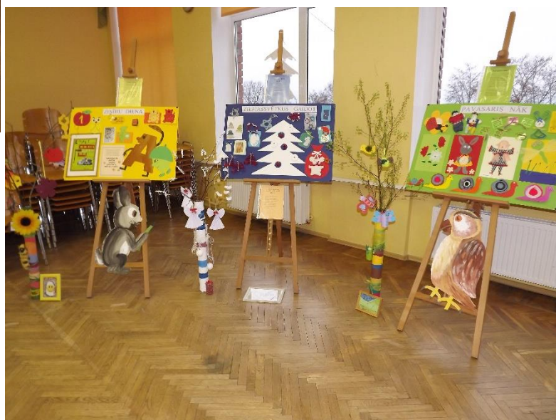
Gadalaiku princips izvēlēts Tukuma 2.pamatskolas pedagogu darba pieredzes stendos.