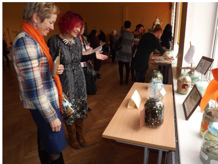
Ļoti daudzus izstādes apmeklētājus uzrunāja Engures vidusskolas pasākuma "3 litri dzejas" ideja