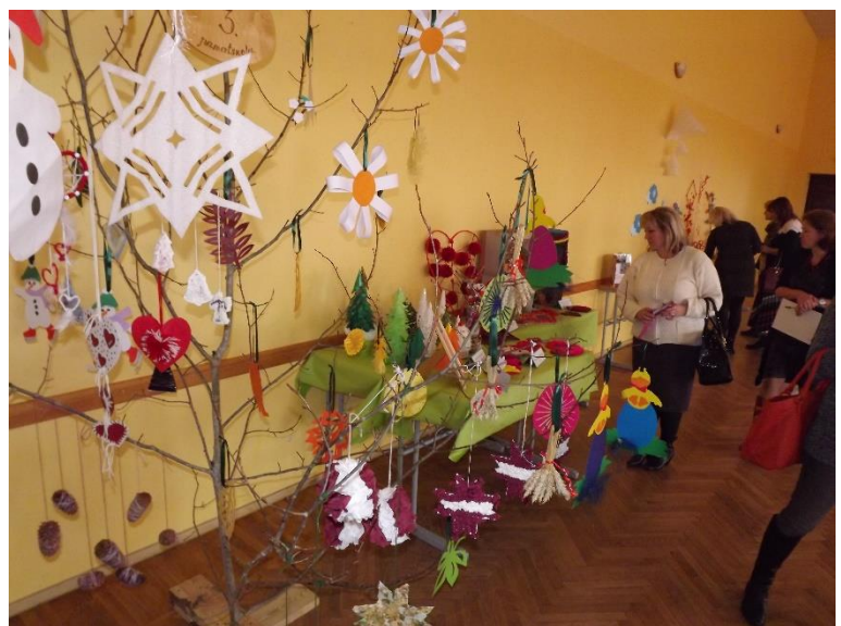
Bagātīgi sakopojis Tukuma 3.pamatskolas pedagogu ideju koks