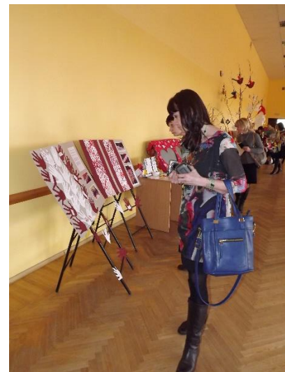
Tukuma Vakara un neklātienes vidusskolas stendā varam gūt patriotiskas idejas valsts svētkiem un ne tikai ... arī Valentīndienai un citām skolas aktivitātēm interešu izglītības jomā