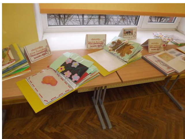
Daudz praktisku ideju varēja smelties Pūres pamatskolas Jaunsātu filiāles pedagogu darbu apkopojumos