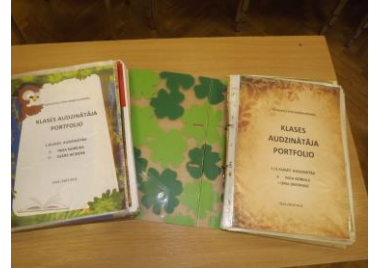
Bagāta pieredze apkopota Dzirciema internātpamatskolas un Milzkalnes sākumskolas pedagogu darba mapēs