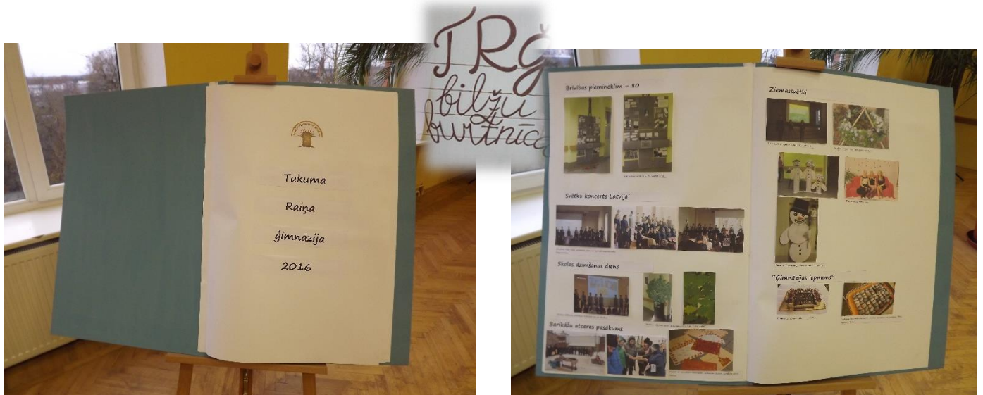
Turpat blakus Tukuma Raiņa ģimnāzijas Bilžu burtnīca, kurā var apskatīt fotogrāfijas dažādām svētku un pasākumu idejām