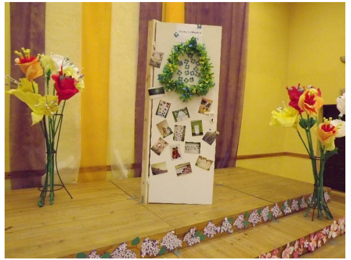
Zāles skatuves daļā izvietota Tukuma 2.vidusskolas ekspozīcija idejām par telpu rotājumiem un noformējumiem dažādiem svētkiem